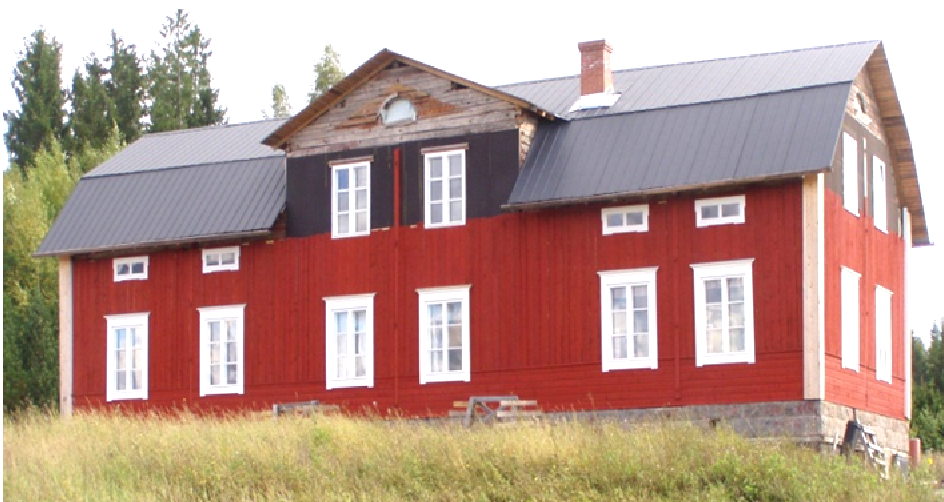
Varpulan talo takaa Sipooossa 2010 (vas.)

Varpulan talo takaa Kauhavalla 2003. Tuvan vanha uunion sortunut seinänläpípihalle (oik.)