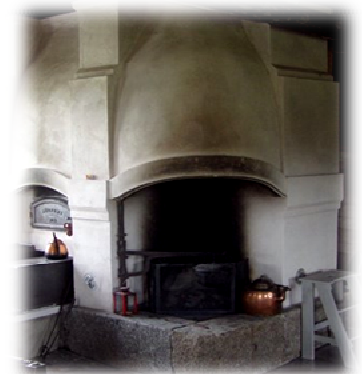
Varpulan tuvan tunnelmaa