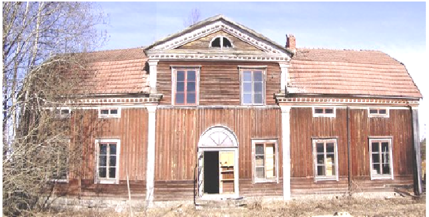
Varpulan talo edestä Kauhavalla 2002 (yllä)

Varpulan talo rakennettiin v. 1833 Kauhavalle Lapuan vanhan 1700-luvun kirkon hirsistä. V. 2003 huonokuntoinen talo purettiin ja siirrettiin Kauhavalta Sipooseen Talmaan, jossa se on tarkoitus palauttaa pikkuhiljaa alkuperäiseen asuunsa. Katso talon vaiheet www.varpula.fi