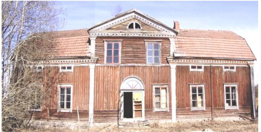
Varpulan talo edestä Kauhavalla 2002 (yllä)

Varpulan talo rakennettiin v.1833 Kauhavalle Lapuan vanhan 1700-luvun kirkon hirsistä. V.2003 huonokuntoinen talo purettiin ja siirrettiin Kauhavalta Sipooseen Talmaan, jossa se on tarkoitus palauttaa pikkuhiljaa alkuperäiseen asuunsa. Katso talon vaiheet www.varpula.fi